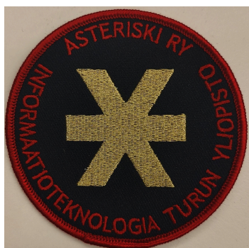
Kuva 3 Ansiomerkki kangasmerkki