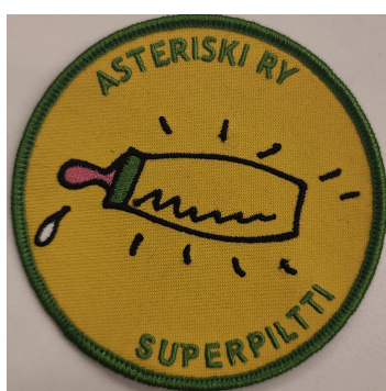
Kuva 2 Superpiltti kangasmerkki