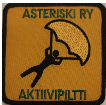
Kuva 1 Aktiivipiltti kangasmerkki